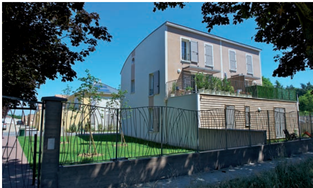
L'efficacité énergétique s'invite aussi dans les constructions neuves, comme dans ce programme de maisons à ossature bois, à Combs-la-Ville.

Grand Paris Sud est partenaire du 2 e Forum de la rénovation énergétique de l'habitat , organisé le 14 octobre par le Conseil départemental de l'Essonne. La manifestation est ouverte à tous les habitants qui souhaitent rénover leur logement et rencontrer des professionnels spécialisés.