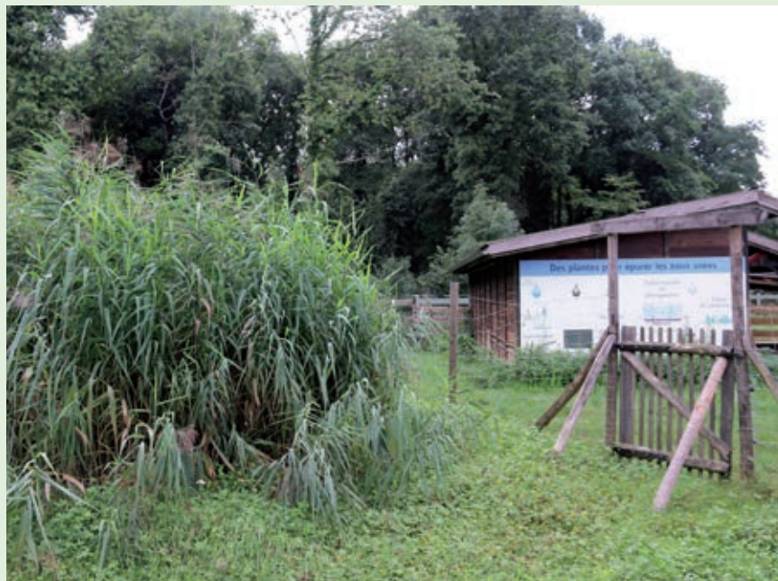
Les nouvelles toilettes sèches et le dispositif d'assainissement de la Maison de l'environnement, constitué d'un filtre naturel planté de roseaux.