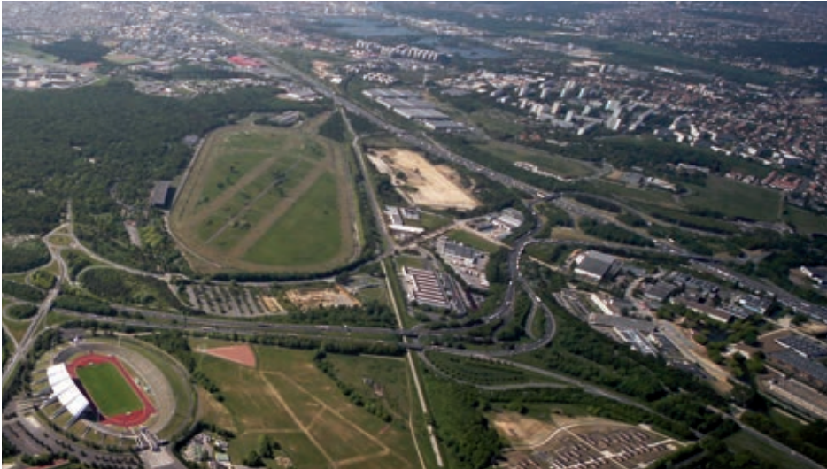
Plus qu'un stade, un potentiel foncier de 130 hectares destiné à accueillir la Cité du Sport du Grand Paris.

Grand Paris Sud et les villes de Ris-Orangis et Bondoufle , où devait être réalisé le Grand Stade de rugby, ont décidé d'engager un recours de plein contentieux contre la Fédération Française de Rugby (FFR) auprès du tribunal administratif.