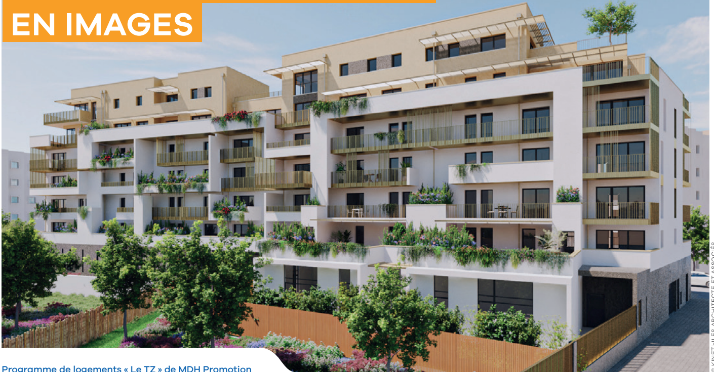
Programme de logements « Le TZ » de MDH Promotion