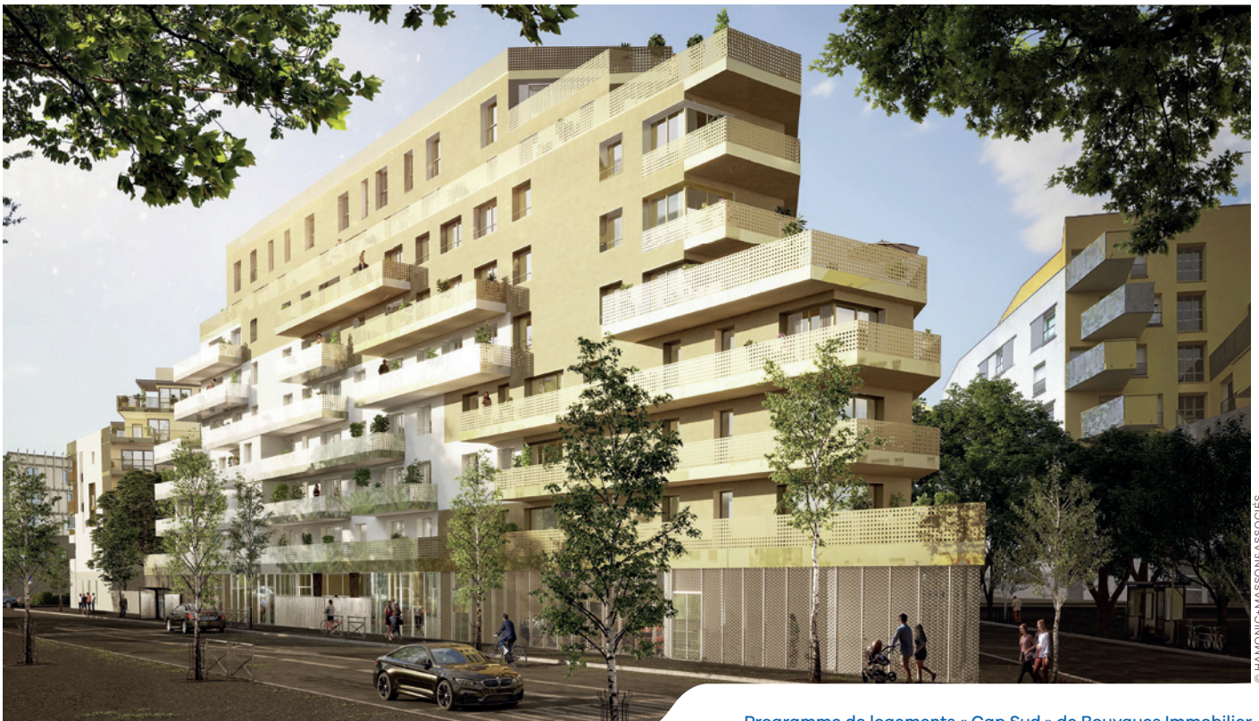
Programme de logements « Cap Sud » de Bouygues Immobilier