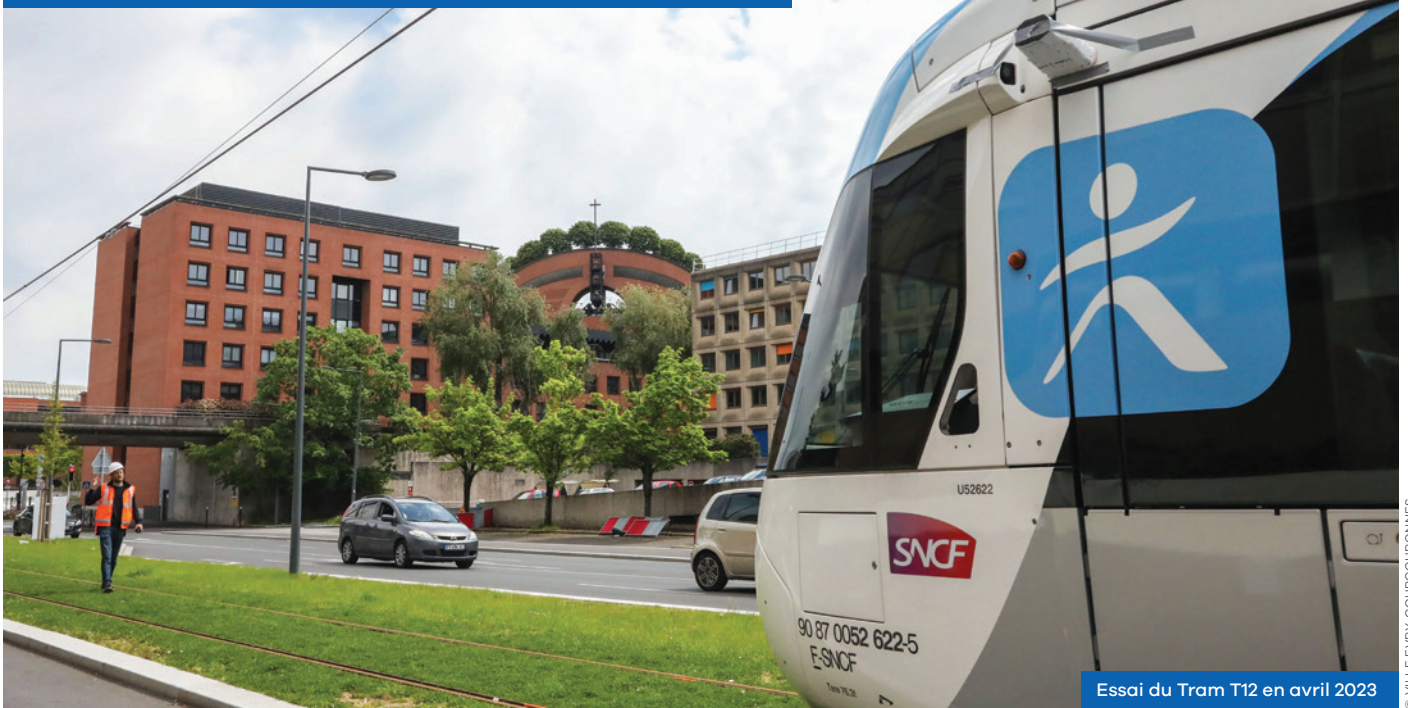
Essai du Tram T12 en avril 2023