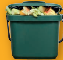
LES BIOSEAUX (1 par foyer participant)