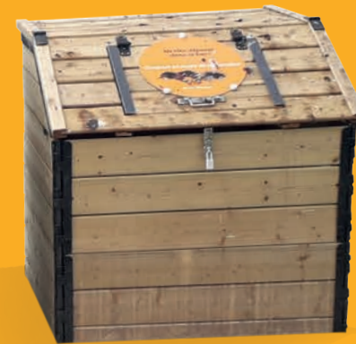
3 COMPOSTEURS DE 700 L EN BOIS (plus en fonction du nombre de participants) avec grille anti-rongeurs et bâche